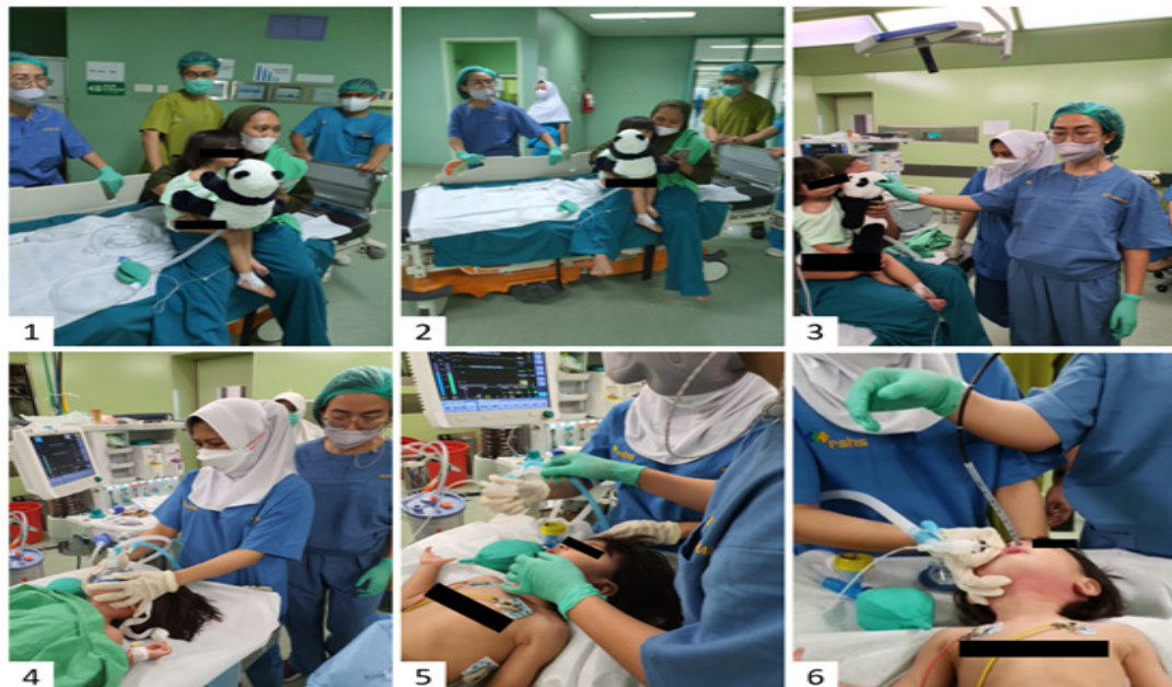
Gambar 3 (1) Perhatikan Boneka Panda yang Menyembunyikan Sirkuit Jackson-Reese; (2) Kehadiran Orangtua Diperlukan; (3) Inhalasi Melalui Boneka Panda; (4) Dua Dokter Anestesi Hadir; (5) Tabung ETT yang Dimodifikasi untuk NPA; (6) Intubasi Fiber Optic .