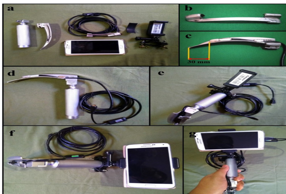
Gambar 1 Clip-on Smartphone Camera Video-laryngoscope

Ket.: Alat disiapkan berupa laringoskop Macintosh, clip-on smartphone camera , smartphone Samsung Galaxy S5 , docking smartphone fotopro SJ-85 (a). Smartphone camera dipasang pada alat penjepit (b) yang selanjutnya dijepitkan pada bilah Macintosh (c). Jarak ujung kamera terhadap ujung bilah sebesar 30 mm. Bilah Macintosh yang sudah dipasangkan clip-on smartphone camera dipasangkan pada handle (d). Pada handle laringoskop dipasangkan docking untuk smartphone (e). Kemudian smartphone dipasangkan pada docking tersebut dan disambungkan dengan clip-on smartphone camera (f)